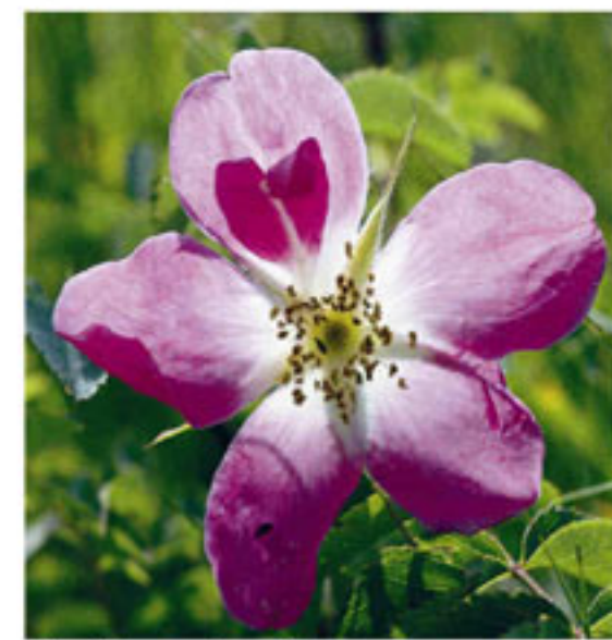
Alpen-Ilagrose - Rosa alpina