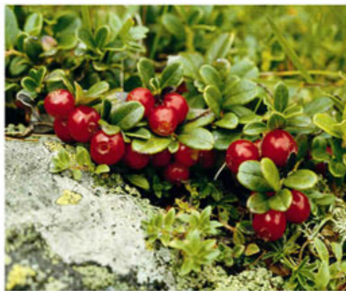
Preiselbeere - Mirtillo rosso

✗ Lage: Gemeinden Eppan und Kaltern; 510 - 527 m Meereshöhe ✗ Größe: 23 ha, ✗ Schutz: seit 1979 ✗ Position: Comuni di Appiano e di Caldarò; 510 - 527 m s. l. m. ✗ Estensione: 23 ha ✗ Tutela: dal 1979