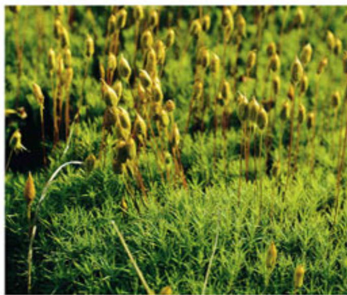
Haarmützenmoos - Muschi