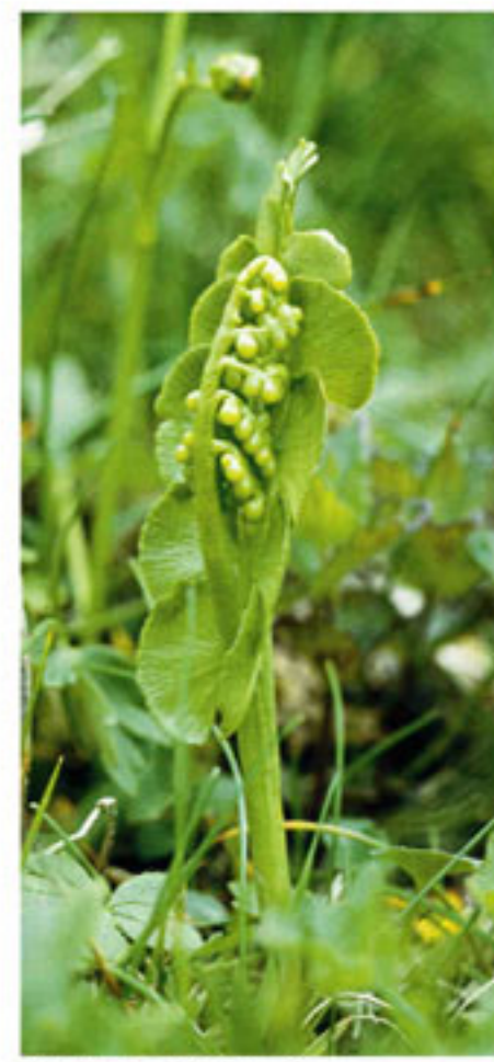
Mondraute - Erba lunaria