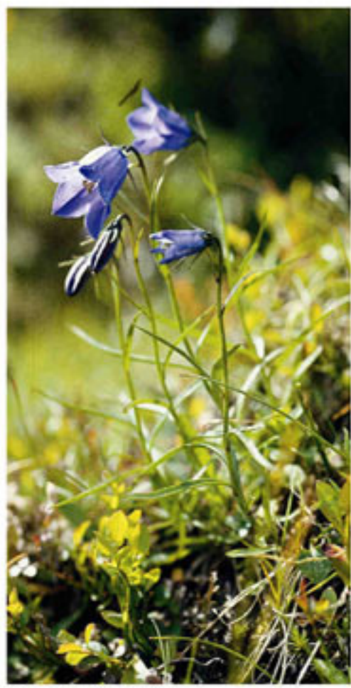
Scheuchzers Glockenblume Campanula di Scheuchzer