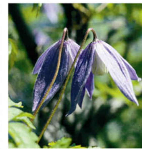
Alpenrebe - Clematide alpina

✗ Lage: Gemeinden Eppan und Kaltern; 510 - 527 m Meereshöhe ✗ Größe: 23 ha, ✗ Schutz: seit 1979 ✗ Position: Comuni di Appiano e di Caldarò; 510 - 527 m s. l. m. ✗ Estensione: 23 ha ✗ Tutela: dal 1979