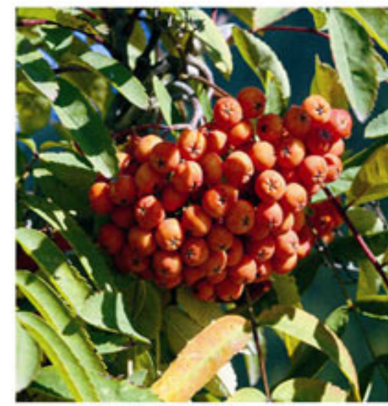
Vogelbeere - Sorbo degli uccellatori