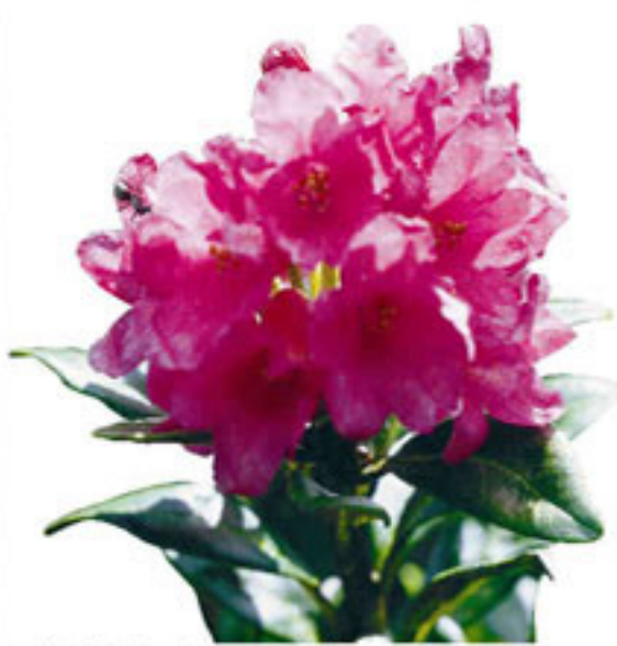
Rostblättrige Alpenrose - Rododendro rosso