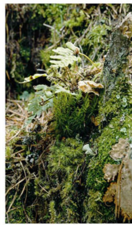
Farne, Moose und Flechten - Farn, muschi e licheni

→ Infolge dieses kühlen Klimas gedeihen hier auf etwa 500 Metern Meereshöhe Pflanzen, die sonst nur in wesentlich höheren alpinen Regionen zu finden sind. Die Vegetationsabfolge ist hier umgekehrt: an der Basis des Kessels gedeihen kälteresistente, am Oberrand wärmebedürftige Pflanzen. Auf engstem Raum findet man so eine große Vielfalt von über 600 Pflanzenarten. → Per il clima fresco, a ca. 500 m, crescono piante che normalmente vegetano in regioni alpine a quota molto più elevata. Le fasce vegetazionali qui sono capovolte: sul fondo della conca crescono piante resistenti al freddo, sul bordo piante che amano il caldo. Si trova così una grande varietà di specie di piante (oltre 600).