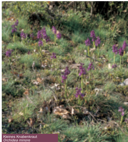
Kleines Knabenkraut Orchidea minore

Die starke Behaarung mancher Pflanzen reflektiert die Sonnenstrahlen und schützt die Blätter vor Austrocknen durch den Wind. Andere schließen den gesamten Vegetationszyklus bis zur Samenreife gleichsam im Rekordtempo ab, noch bevor die Gluthitze des Sommers den Boden ausdört. Andere wiederum speichern Wasserreserven in fleischigen Blättern oder in Zwiebeln.