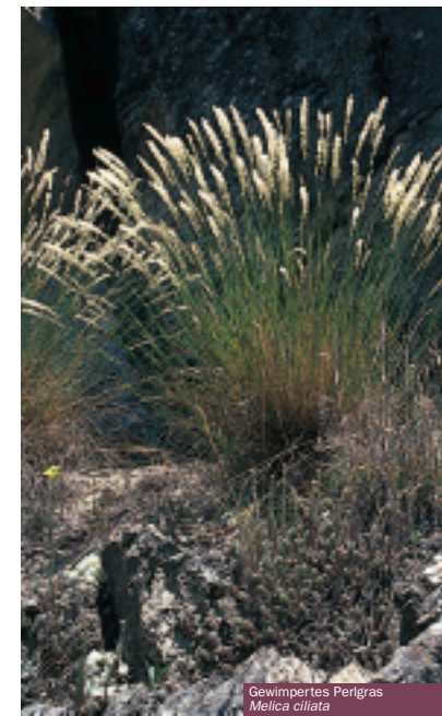
Gewimpertes Perlgras Melica ciliata