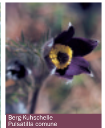
Berg-Kuhschelle Pulsatilla comune

La sanguinaria è un geranio spontaneo dalle foglie profondamente intagliate.