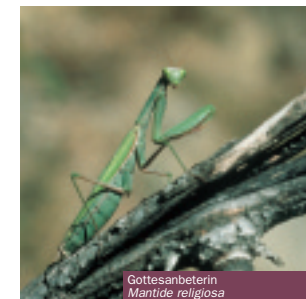
Gottesanbeterin Mantide religiosa