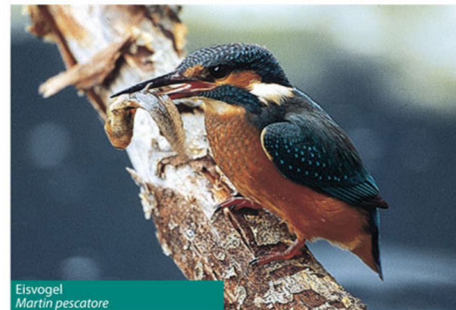
Eisvogel Martin pescatore