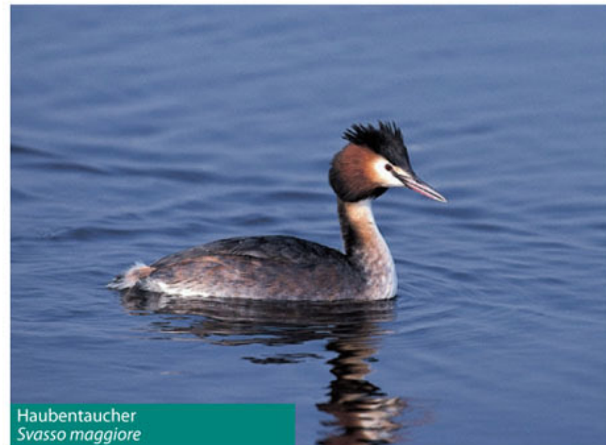
Haubentaucher Svasso maggiore

Qui in primavera ed estate nidificano circa 60 specie: alcune nei canneti, altre sui prati paludosi, altre ancora tra i cespugli o nel bosco.