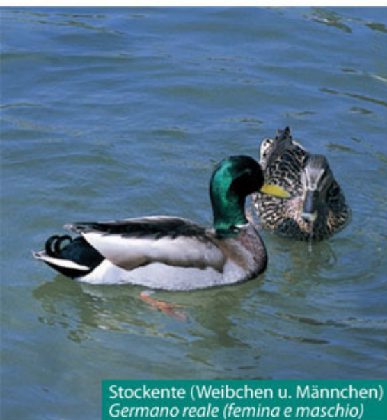
Stockente (Weibchen u. Männchen) Germano reale (femina e maschio)